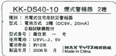
表示銘板貼付例 (底部に貼付)

光電式 マックス株式会社 機種番号: KK-DS40-10 型式番号: 鑑住第 18～66 号