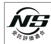
型式適合評価合格の表示（シール） （シールの大きさ：縦 15mm×横 15mm）

日本消防検定協会の型式適合評価に合格した音響装置には、右図のような型式適合評価合格の表示がシールにより表示されます。